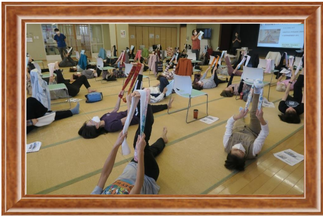
介護予防講座 【股関節痛予防講座】