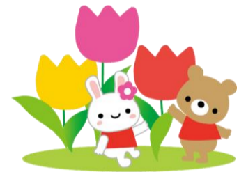
介護予防講座 【サーキット トレーニング】