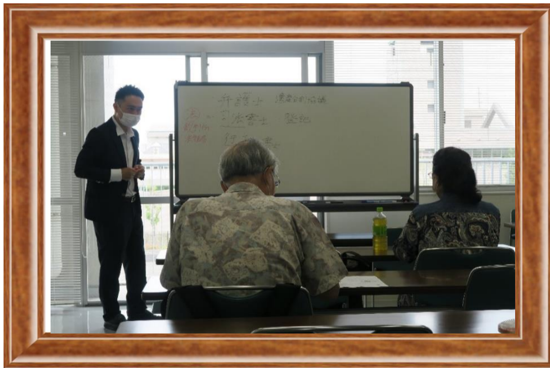
身近な街の法律家 【司法書士に 聞いてみよう！】