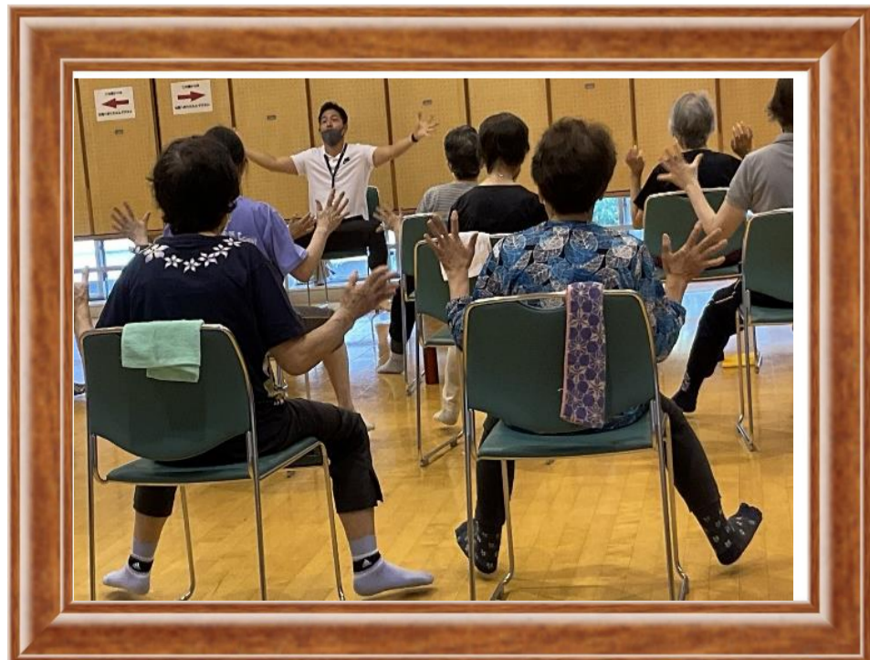
介護予防講座 【かんたんカラダ作り】